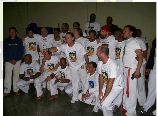
Figura 3 - Mestres do grupo Sensala

É essa exigência de qualidade e nível técnico, aliada à dedicação e consciência dos valores históricos da Capoeira, que tem feito e mantido o nome "SENZALA" como um dos grupos mais antigos e conhecido do Brasil.